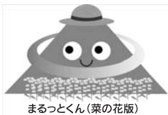
まるっとくん(菜の花版)

鳥海高原は、多様な生態系を保持する豊かな自然が広がる一方、高原の気候を活かした農業や畜産業が営まれ、また温泉、牧場、キャンプ場、青少年の体験学習施設などの観光施設も多く点在しています。