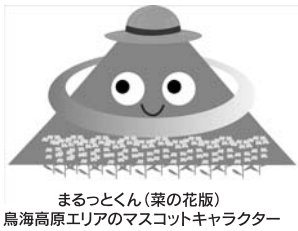
まるっとくん(菜の花版) 鳥海高原エリアのマスコットキャラクター